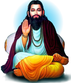
संत शिरोमणी रविदास महाराज