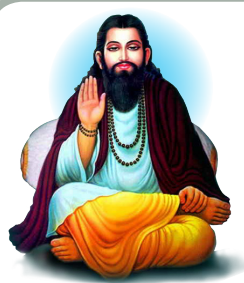
संत शिरोमणी रविदास महाराज