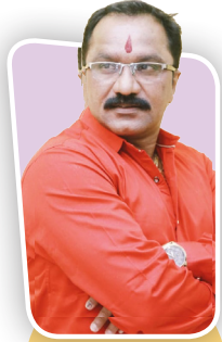
आर या पार